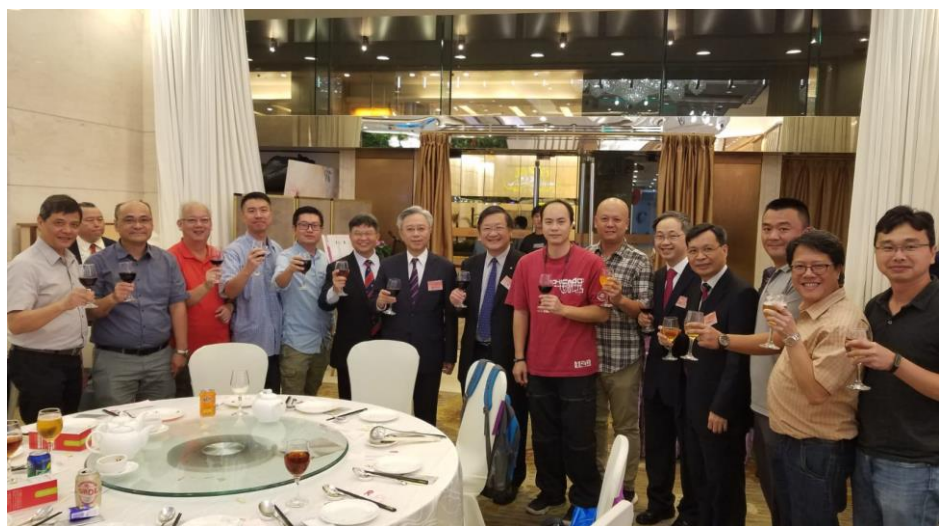
本會出席香港公務員團體慶祝中華人民共和國成立 70 年國慶晚宴